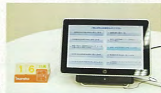
保険薬局掲示物電子データ