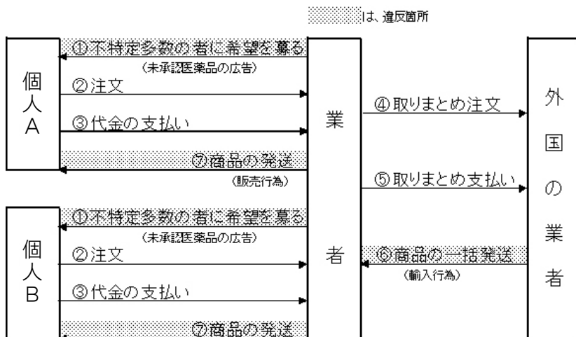
図1. 業者による輸入行為