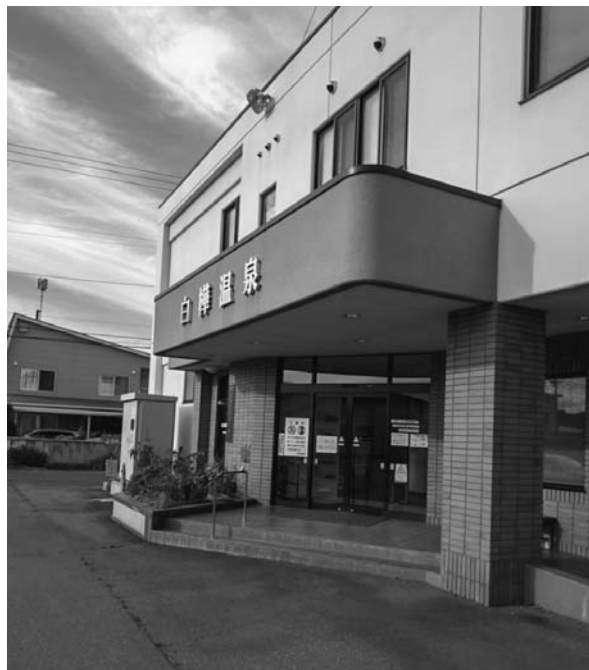
参考資料①：帯広市内にある白樺温泉。町の銭湯然とした佇まいだが、源泉かけ流しである。

帯広市の温泉に関しては私自身もリサーチ不足なので、市内にある温泉についてあまり多くを語ることはできないのですが、朝風呂で利用した光南温泉も44.1℃と適温で湧出しており、恐らく帯広では市内各地に点在する温泉銭湯の多くが、このような好条件でお湯を提供しているのではないかと思います。