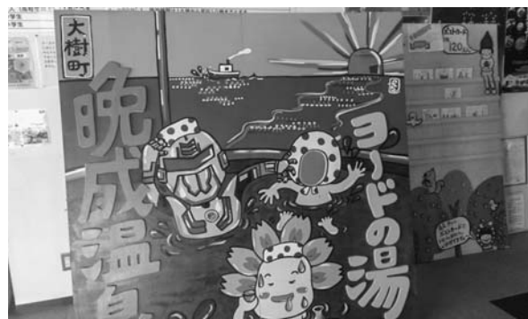
参考資料③：お湯の色も茶色く描写されており、腐植質の存在を感じさせるお湯。

いずれも透明な温泉であり、見た目にも腐植質の存在が否定されています。これは北海道内の温泉としては少し珍しいタイプの温泉といえますが、帯広市近郊のような地下深くの土砂類に水が染みて生じる多層型温泉とは異なり、ナウマン温泉は岩盤の隙間に水が溜まって生じる裂か型温泉らしいので、色が透明なのはそれが理由だと思われます。染みた水が岩盤層を通過する際に不純物が濾しとられ、残った炭酸水素イオンが液性をアルカリにしているというわけです。浦幌留真温泉の場合も、炭酸がガスではなくイオンとして液中に溶ける為には相当な圧力が必要となる筈ですから、やはり重い岩盤層に濾された裂か型温泉だと思われれます。